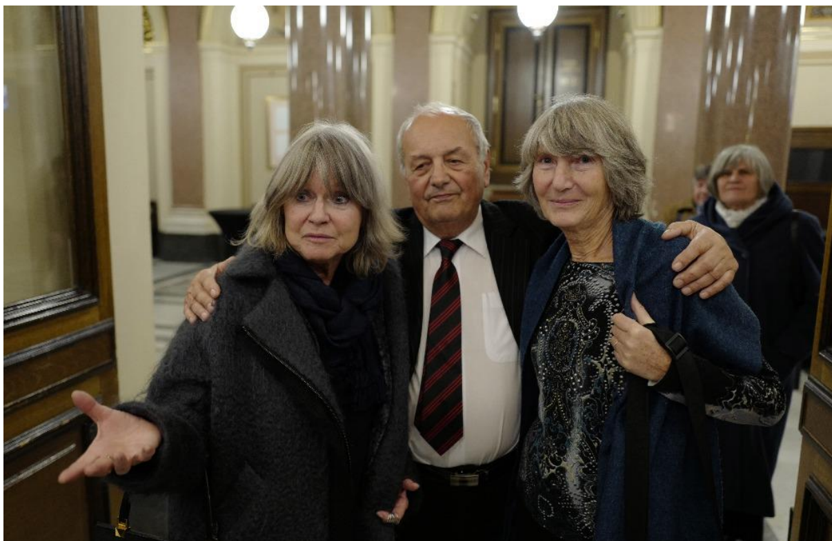
....a Pegas, jako obvykle, s děvčaty v rozpuku.