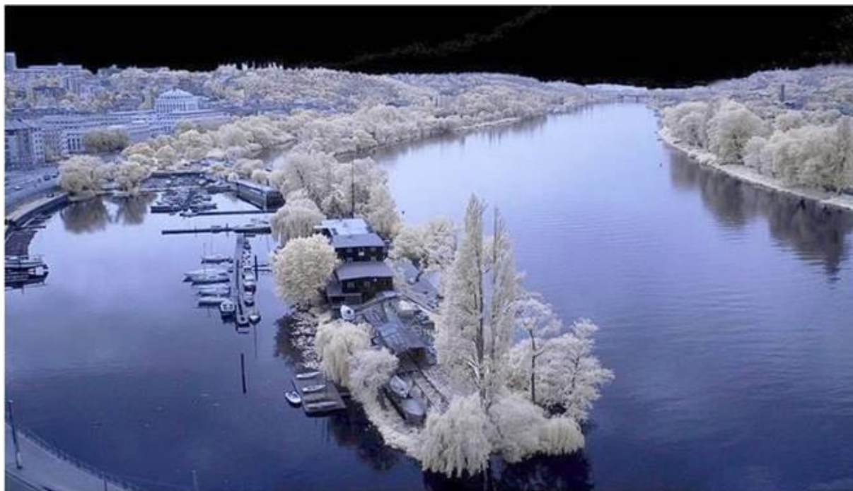
Bez dalších slov - zdravím – Selim