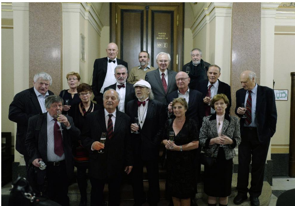
A pak my, po koncertě s bublinkami...